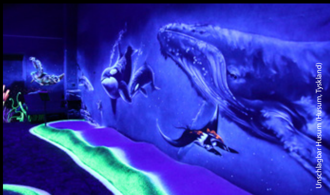
Unschlagbar Husum (Husum, Tyskland)