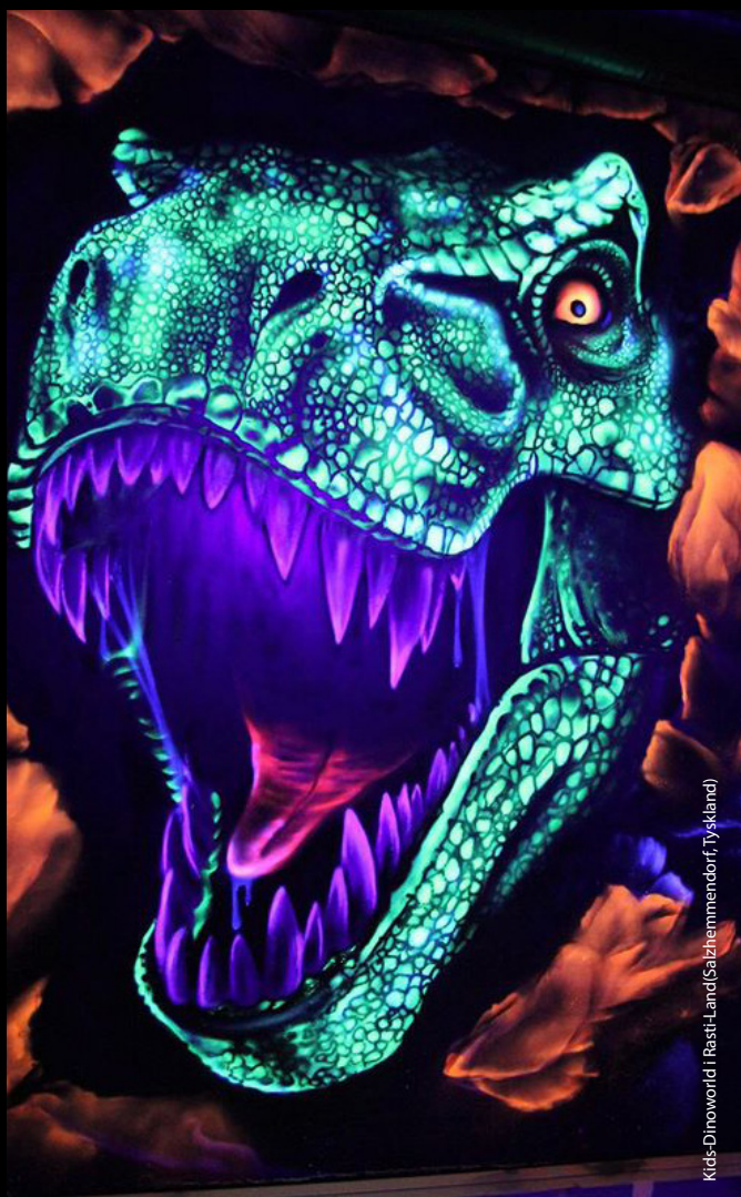
Kids-Dinoworld i Resti-Land (Saxhemmendorf, Tyskland)